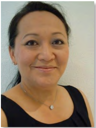
Thi Pic Ismael Pflegehelferin SRK Selzach