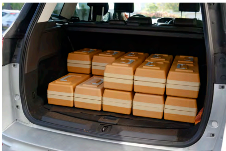
Mahlzeitendienst-Fahrer Valentin Flury im Einsatz

Kontaktieren Sie uns, um den Mahlzeitendienst der Spitex Aare in Anspruch zu nehmen oder wenn Sie weitere Informationen benötigen: